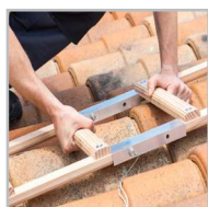
Fonction sûre par écrous griffe