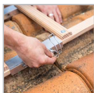
Fixation simple et pratique