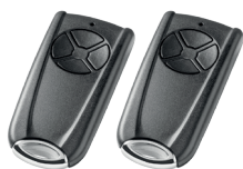
EuroPro 720 2 émetteurs RSC 4 BS