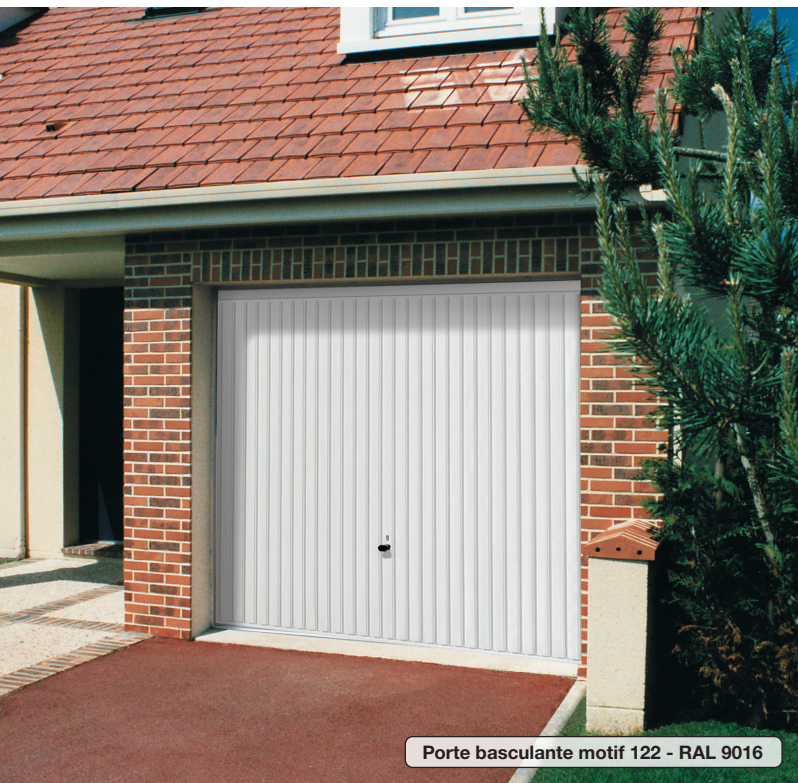
Porte basculante motif 122 - RAL 9016

Porte basculante avec cadre dormant en acier galvanisé, panneau à rainures verticales.