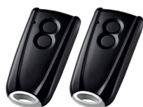
EuroPro 700 2 émetteurs RSC 2