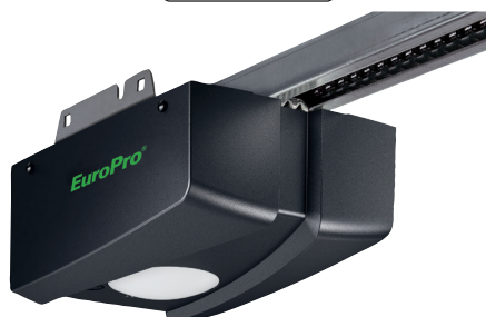
EuroPro 700 ou 720